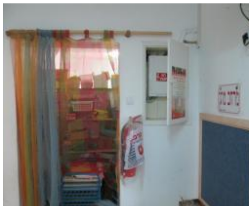
תמונה 2 : אולם הגן